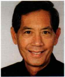
Prof. Dr. Bhakdi

Es besteht die Gefahr, dass künftig auf jegliche Infektionswellen reagiert wird, indem man Alte wegsperret, Jungen die Bildungschancen raubt und die übrigen in den Lockdown schickt. Das Leben in einer derartigen Expertokratie wäre nicht lebenswert, denn wichtige Werte wie Kunst und Kultur, Sport, Nähe und sozialer Zusammenhalt würden zugunsten einer Fixierung auf bloße „Fallzahlen“ geopfert, die wenig aussagen. Die wiederholten Fehlprognosen eines überlasteten Gesundheitssystems sind als Begründung untauglich, zumal Deutschland über eines der leistungsfähigsten Gesundheitssysteme der Welt verfügt. Für das neue Jahr wünschen wir uns eine Rückkehr zur alten Normalität.